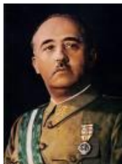
El General Franco

¡Qué diferente es la España de hoy! En 1975 Francisco Franco murió y España abrió sus puertas al mundo. El gobierno de España se transformó de una dictadura a una monarquía constitucional con Juan Carlos de Borbón como el rey.